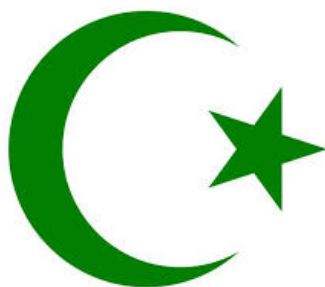
Ishtar er Houbal ou Shahar et Hillel