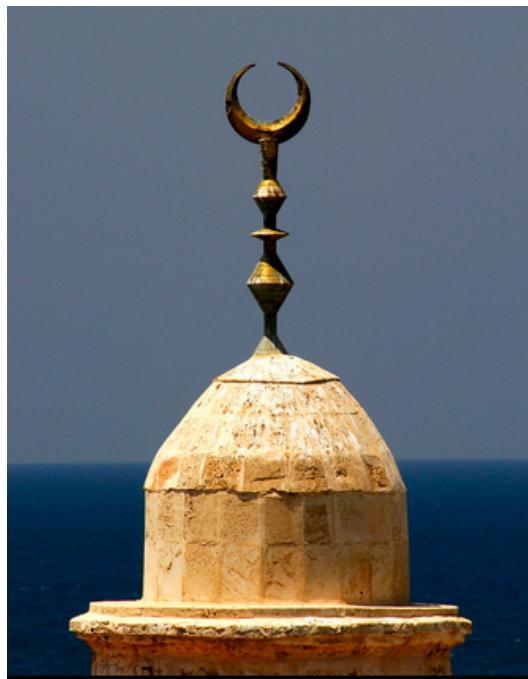
Houbal après l'arrivée de Islam

Ce qui est incroyable dans cette histoire, c'est qu'Houbal est encore vivant aujourd'hui. Les Musulmans y tiennent encore, ses flèches sont les 7 minarets de la Mecque, au bout desquelles les croissants de lune symbolisent sa présence, comme pour nous dire qu'il trône toujours sur les lieux "Saints"... Houbal ne veille pas seulement sur les pèlerins de la Mecque à l'occasion du Hajj, toutes les mosquées du monde, en plus d'être tournées vers la Mecque, donc vers lui, sont construites sur cette même symbolique païenne: les minarets représentent ses flèches , et pour ceux qui en douteraient encore, ces flèches-minarets finissent en croissants de Lune!