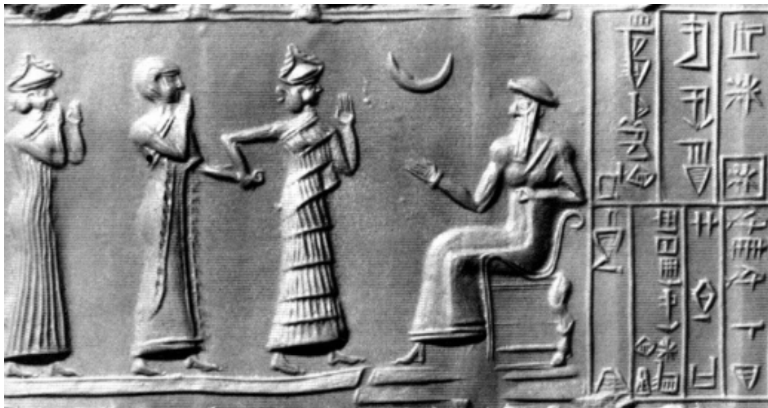
Tablette représentant le roi sumérien Ur-Nammu sous la protection du dieu-lune Sine

D'après l'historien et auteur Sinazi Gunduz (8), le dieu-lune Sine a deux enfants: une fille et un fils. La fille c'est " Ishtar " la plus célèbre des déesses de l'antiquité dont la renommée s'étendra jusqu'à l'Occident. Dans la Grèce antique elle s'appelle Aphrodyte (9), les Romains l'appellent Vénus. Les dieux de l'Olympe ne sont pas Européens, ils sont Mésopotamiens et Arabes, les "Judéo-Chrétiens"