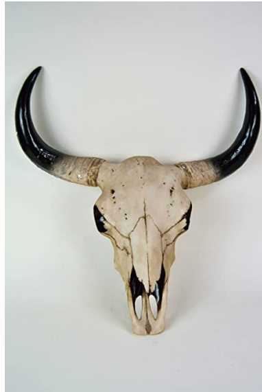
Joli croissant de lune

Ne vous y trompez pas, ces cornes ne sont pas des trophées que les présentateurs, producteurs ou réalisateurs de ces programmes auraient ramené de leurs derniers safaris. Ces cornes sont juste là comme des symboles d'appartenance des élites du moment au culte de Sine, leur bon vieux dieu-lune, celui que les arabes appelaient Houbal et que la culture populaire moderne connaît aujourd'hui sous le nom de Baal.