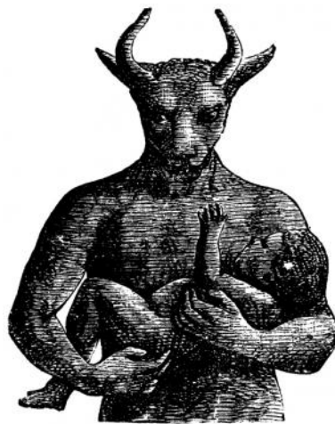
Les deux cornes de Baal