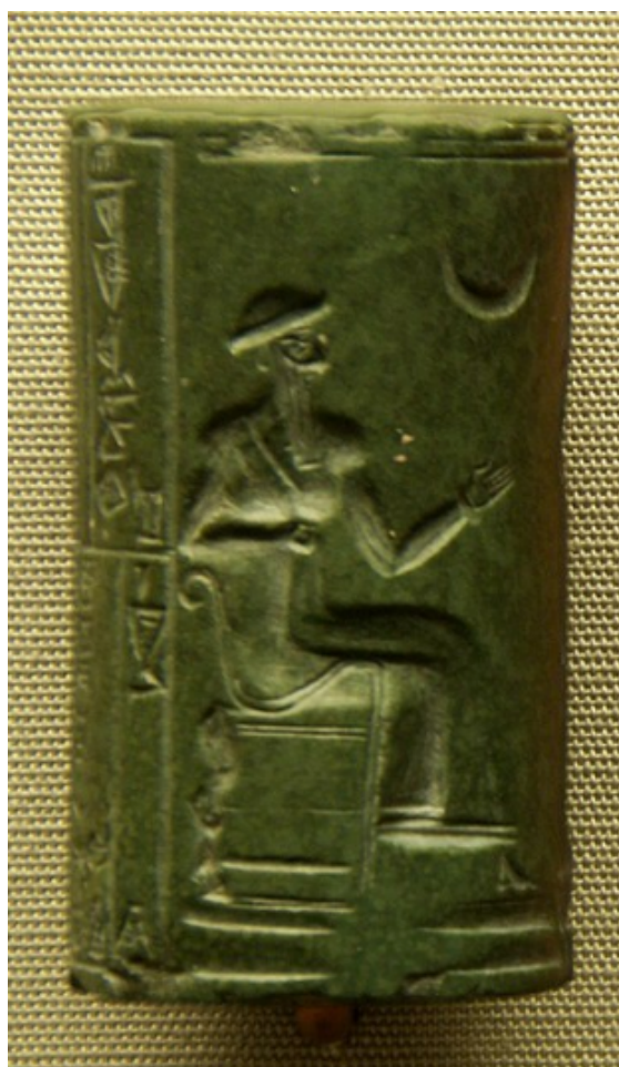
Sine ou Houbal?

Comme vous pouvez le voir sur la tablette du dessous, ce qui distingue Sine et Houbal des autres dieux c'est le croissant de lune dont il ne se sépare jamais, rien de plus normal à cela puisque Sine et Houbal sont tous les deux le Dieu-lune de l'antiquité.